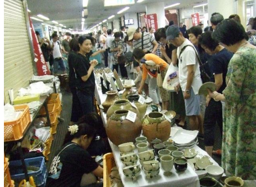
多くのお客様に買って頂きました