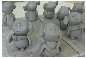
一つ一つ表情が違います