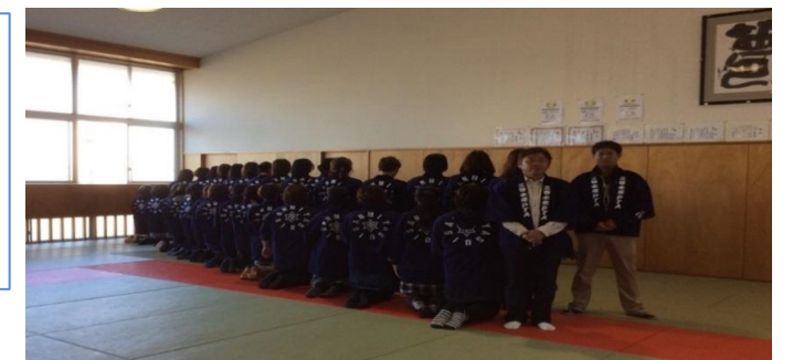
☆おそろいのハッピーで記念撮影☆ おつかれさまでした♪

PTA会長のもと、幹事みんなで準備から片付けまで協力し合い無事に終えることができました。今年度も達成感いっぱいの水高祭でした！