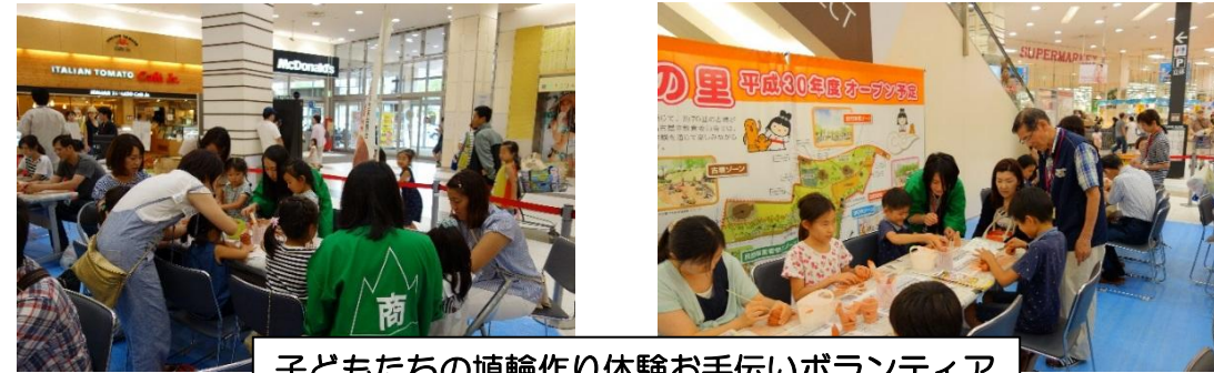
子どもたちの埴輪作り体験お手伝いボランティア