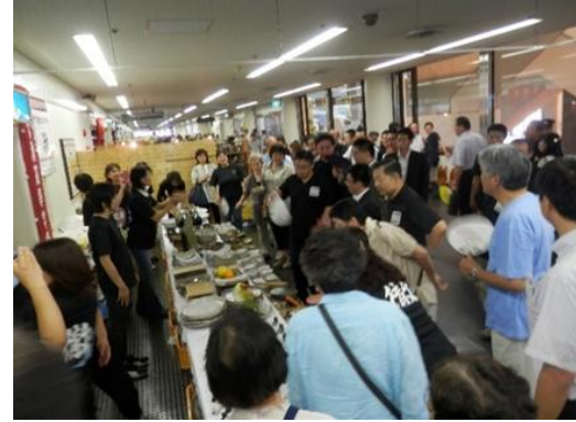
昨年、大村知事にもお買上げ頂きました