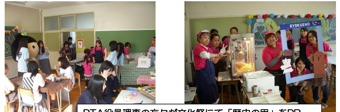
PTA役員理事の方々が文化祭にて「歴史の里」をPR + 参観保護者へPTA活動紹介