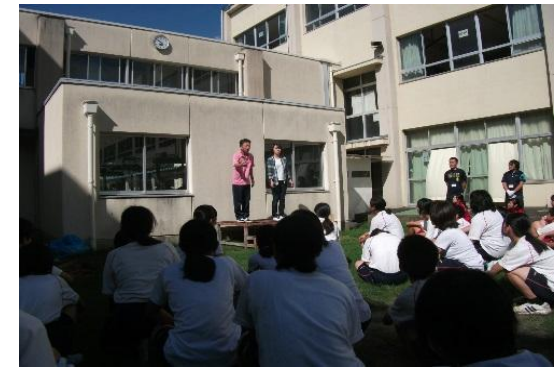
挨拶をするPTA美化活動班長