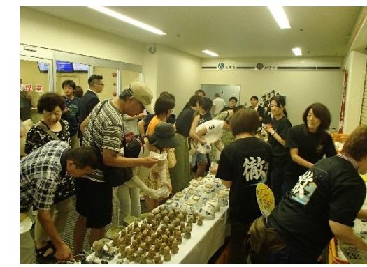
校訓「徹」をプリントしたそろいのTシャツ(通称「徹T」)を着て販売します