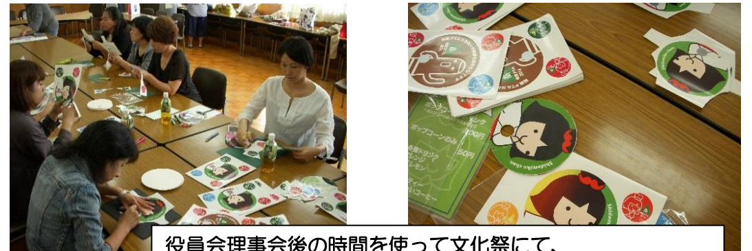
役員会理事会後の時間を使って文化祭にて、参観保護者へ配布するしだみこちゃんグッズを制作