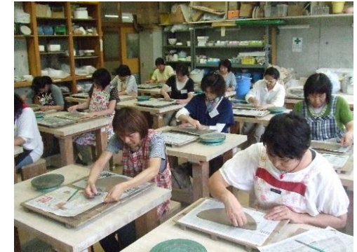
板状の粘土を使ってのお皿作り(たたら成形)

[参加者の感想] ・お茶碗の絵付け、お地藏様、招き猫、たたらのお皿作り、ろくろ体験ができて楽しかったです。 ・お茶碗、コーヒーカップ、小鉢と3年間で全部揃えま