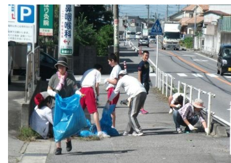
生徒とともに歩道のゴミ拾いと草取り