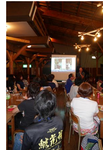
学校行事等のスライド鑑賞