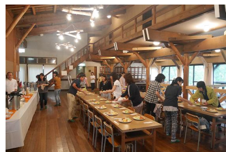
林間学舎内、ホールにて食事準備