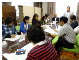
役員会から委員会へ 学校からPTAから発信