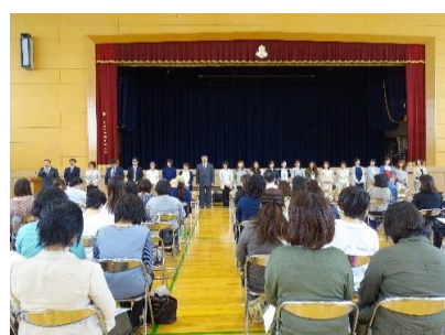
PTA総会では 制服リサイクルも実施