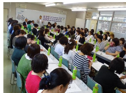
委員会では学校の様子も紹介 学校と連携してすすめます。