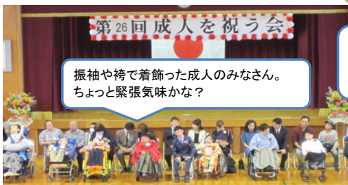
振袖や袴で着飾った成人のみなさん。ちょっと緊張気味かな？

記念品 千社札 フォトフレーム 毎年、卒業生が働いている作業所の仲間に依頼しています。