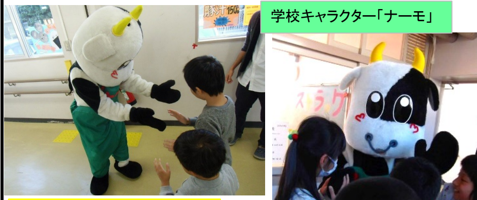
学校キャラクター「ナーモ」

PTA総務委員会を中心に、幼児児童生徒が楽しめる文化祭になるように、大勢のPTAの方が事前準備、仕入れから当日の調理、販売まで協力し合って模擬店をだすことができ、文化祭も盛大に終わることができました。今後も、名古屋盲学校をPRしたり、盛り上げていったりできるように活動したいと思います。