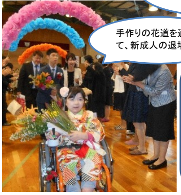
手作りの花道を通して、新成人の退場で

長い間続けている成人を祝う会。式典には、県・市議会議員、青い鳥医療療育センター長、元校長、同窓会長、元PTA会長など、多数の来賓の方々がお祝いに来てくれます。これからも、私達PTAは、卒業生の成人の日をお祝いしていきたいと思います。そして、あなたたちは愛されているということを伝えていきたいです。