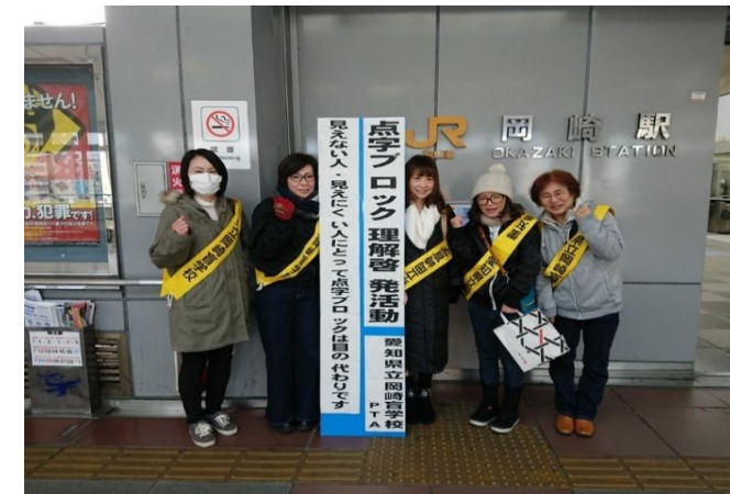
〈活動後の記念撮影〉