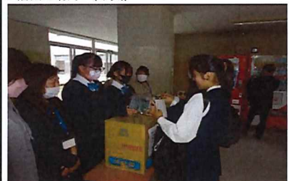
有志生徒と協力して寄付品を集めました。お話ししながら、和気あいあいとした雰囲気でした。