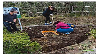
芝桜を植えました。