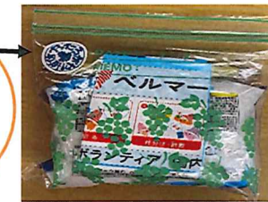
ベルマーク回収の案内も入れました!