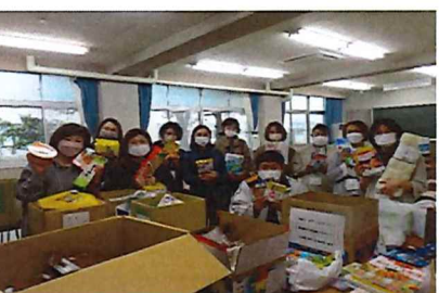
段ボール13箱分の寄付が集まりました。協力して下さった皆さん、ありがとうございました。

11月11日(木)の東日新聞、東愛知新聞(地元紙)2紙に、東三河フードバンク事務局へ寄付をしたことが紹介されました。右はその東日新聞の記事です。