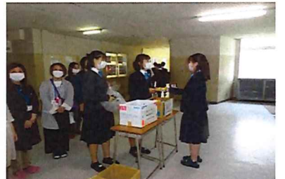
思わずカメラを意識してしまいました...