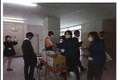
「持ってくるだけでも大変だったよね?」と思わず問いかけたくなるぐらい、協力的でした。