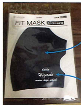
メッセージシール貼付

生徒にマスクを贈ることを決めたPTAの気持ちをメッセージシールに託して、貼って伝えることにした。