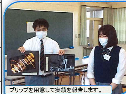
プリップを用意して実績を報告します。