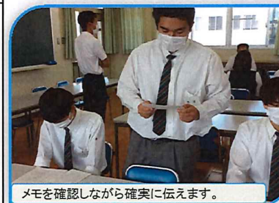
メモを確認しながら確実に伝えます。