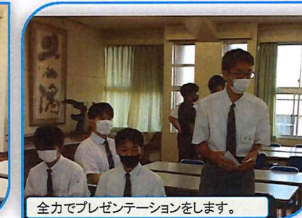
全力でプレゼンテーションをします。