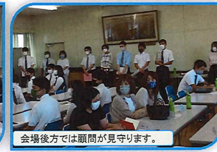
会場後方では顧問が見守ります。