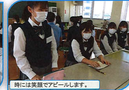
時には笑顔でアピールします。