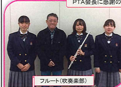
フルーツ(吹奏楽部)